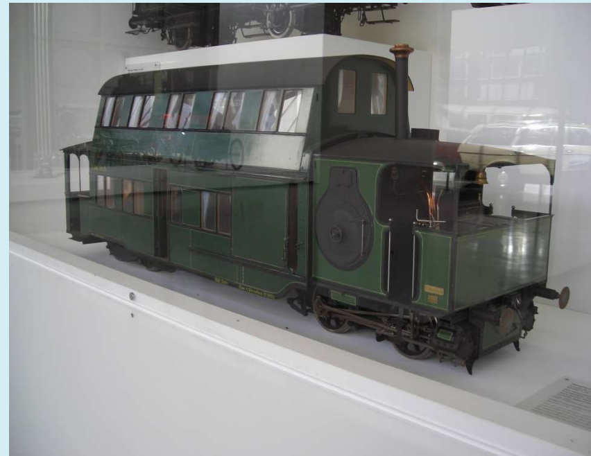
Modell eines Krauss-Dampftriebwagens 1882