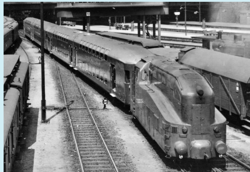
60 001 (vormals LBE Nr. 1) verlässt 1936 mit einer Doppelgarnitur ex-LBE-Doppelstockwagen den Hamburger Hauptbahnhof

Die mit dem Zug verwendeten Dampflokomotiven LBE Nr. 1 bis 3 waren Schnellverkehrs-Tenderlokomotiven der Lokomotivfabrik Henschel in Kassel mit Stromlinienverkleidung, die vom anderen Zugende vom Lokführer ferngesteuert werden konnten.