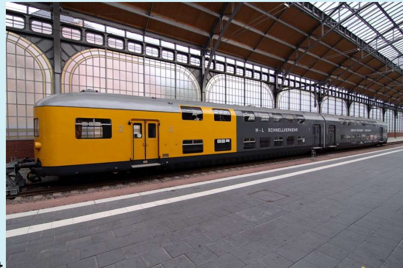
Doppelstock-Stromlinien- Wendezug-Einheit LBE-DW 8