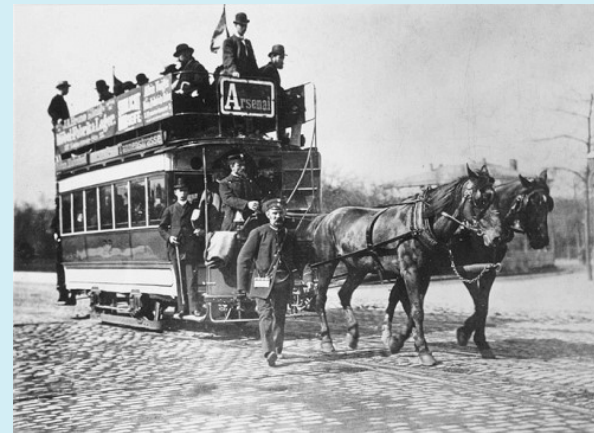
»Imperialwagen« der Pferdebahn in Dresden, ab 1872