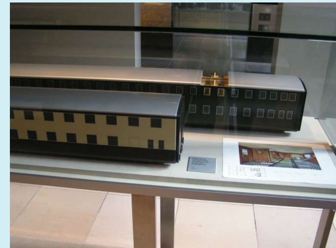
Modelle der doppelstöckigen Breitspurwagen im DB Museum